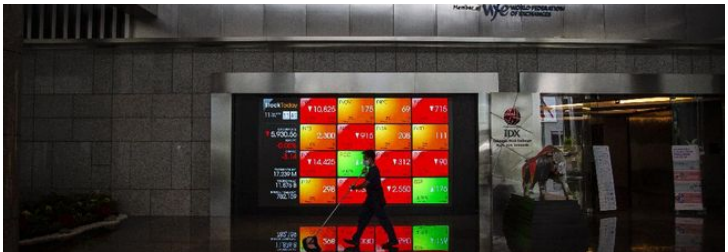
Ilustrasi screen perdagangan saham di BEI

EmitenNews.com - PT Master Print Tbk (PTMR), anak usaha dari PT Mitra Pack Tbk (PTMP) menetapkan harga perdana dalam Initial Public Offering (IPO) sebesar Rp128 per lembar saham pada nilai nominal Rp25 per lembar. Harga itu berada ditengah harga kisaran Rp125 - Rp 135 per lembar ketika book building atau penawaran awal.