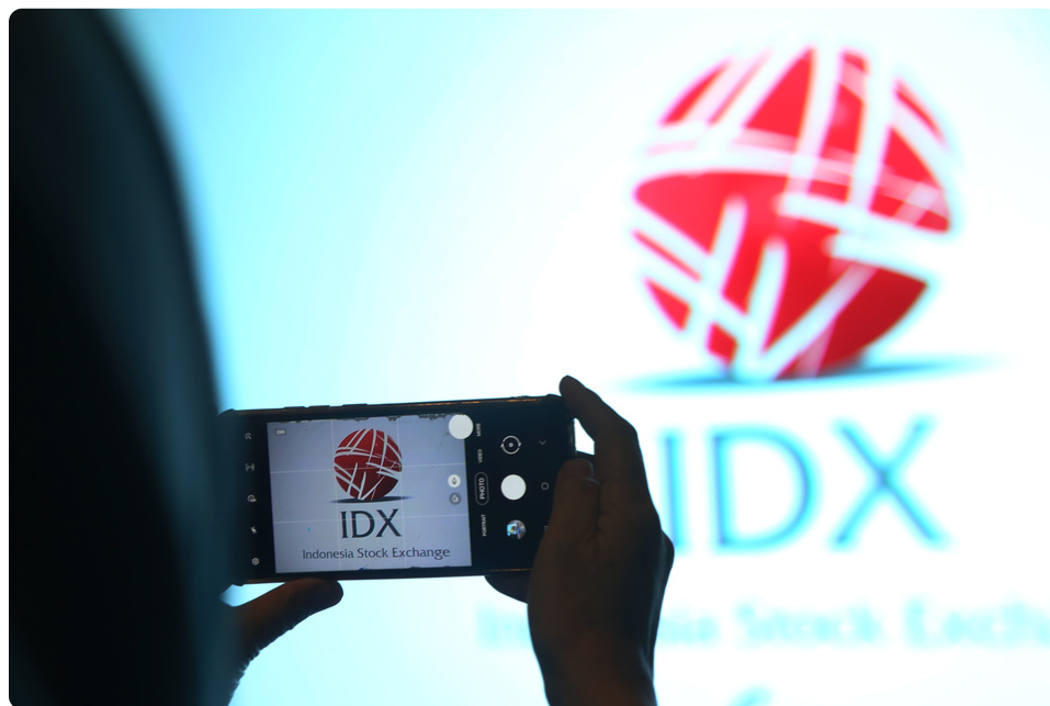
Logo IDX di gedung Bursa Efek Indonesia (BEI), di Jakarta.

JAKARTA, investor.id - PT Master Print Tbk (PTMR) mantap menggelar penawaran umum perdana ( initial public offering /IPO) dengan melepas 435 juta (22,81%) saham ke publik. Master Print merupakan anak usaha dari PT Mitra Pack Tbk (PTMP).