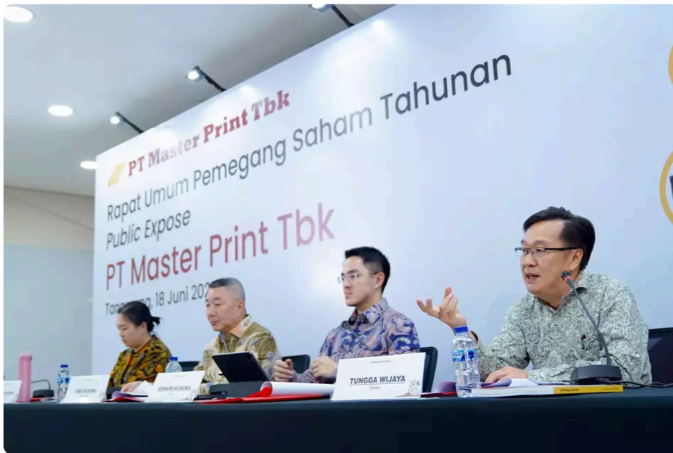
Master Print (PTMP). Ist